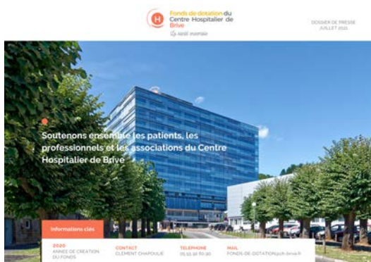
Dossier de presse du fonds de dotation