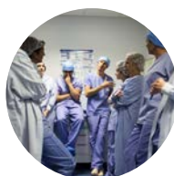
Les professionnels du Centre Hospitalier de Brive