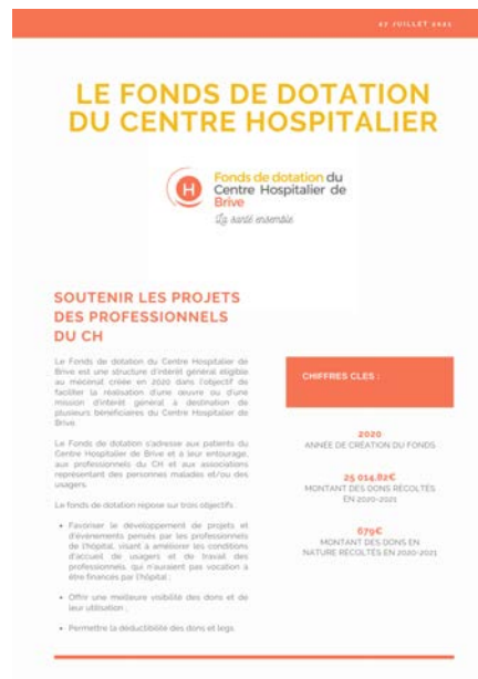
Note d'information interne au Centre Hospitalier de Brive