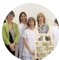
Les associations représentant les personnes malades et/ou les usagers